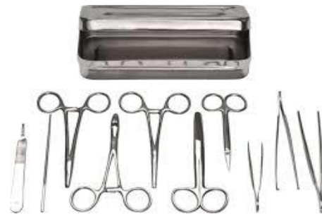
BOITE CHIRURGICAL (PETITE CHIRURGIE)--