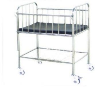
BERCEAU POUR NOUVEAU NEE