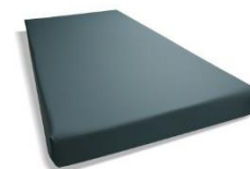
MATELAS POUR BERCEAU