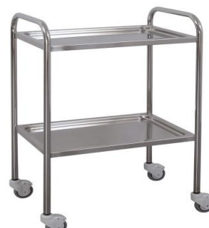
TABLE A PANSEMENT (CHARIOT A PANSEMENT)